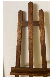
Chevalet en bois Dim : 175 cm H x 55cm Largeur tablette