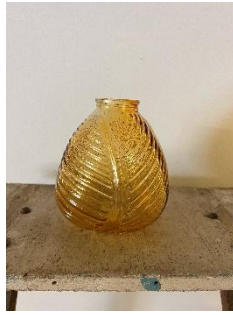
Vases feuilles Dim : 15h x 13diam H14 cm