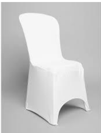
Housse de chaise blanche