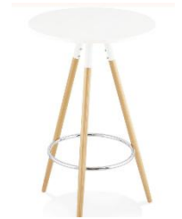
***Mange Debout Naturelle Dim 70cm diam H110cm