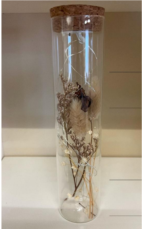
Les vases cylindriques lumineux Dim : 24Hx6 diam