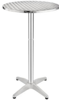
**Table mange-debout pliant Dim : 70 cm ou 80cm, H 110 cm Poids : 7.2kg *Mange debout alu pliant Dim : 115cm H 70 cm diam