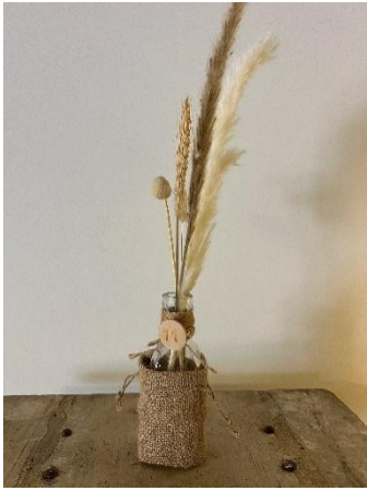
Les Vases jute Dim : H 16 cm