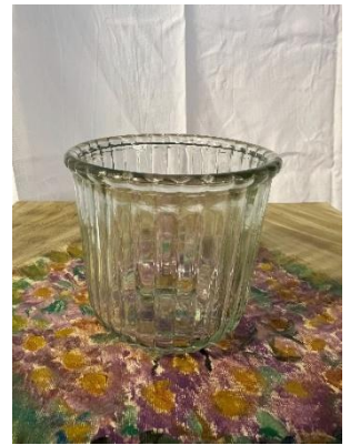
Bougeoirs en verre Dim: 11cm diam 11cm