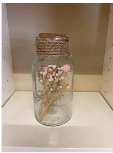
Taille3 :dim 13hx 6cm diam