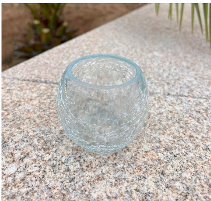
Photophore boule Dim : 7cmH x6cm Diam