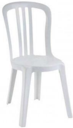
Chaise Miami Bistrot Résine blanche Dimensions : L44cm x P54cm, H88cm. Poids : 2, 45Kg