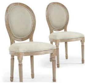
Chaise Médaillon Dim : L49 x P46 xH96 cm, Assise H46 cm