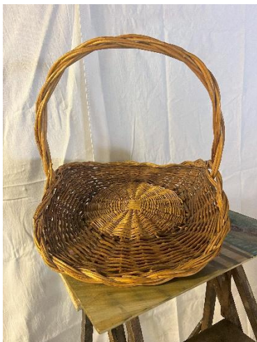
Grande corbeille à pain Dim :