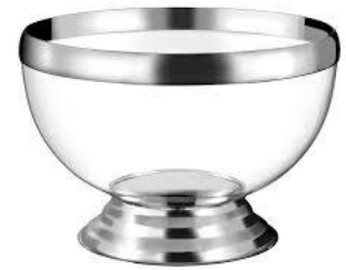
Vasque cocktail 12L +louche