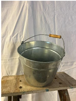
Les Seaux déco Dim : 21cm diam 14hx18diam