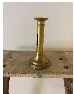
Bougeoirs Dim : H17cm