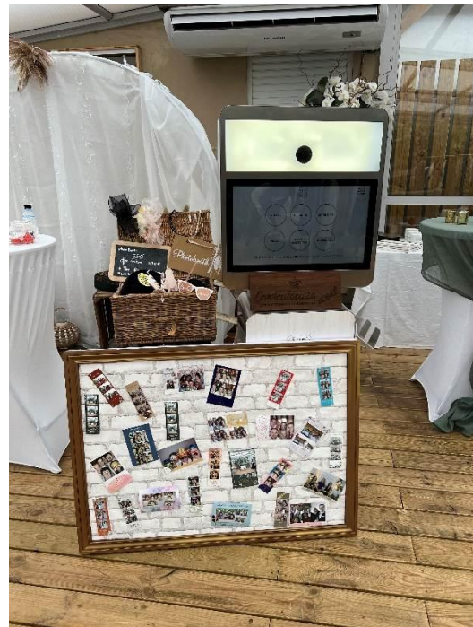
Photobooths 400 photos