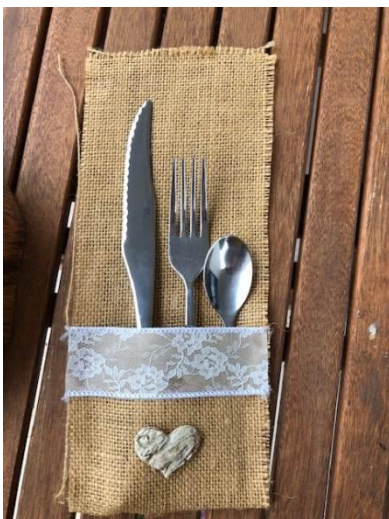
Porte couverte Dim : 28cmx12cm