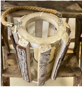
Lanterne en bois