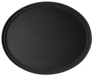
Plateau anti dérapant 40cm