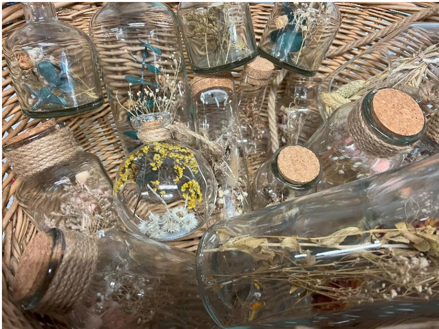
Les Vases boules lumineux Dim : 13hx11diam/ 17h x 11diam /