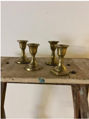
Bougeoirs Dim: H 9cm