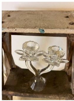
Bougeoir en verre Dim : H_18 cm