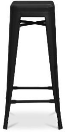
Tabouret haut en fer ou bois Couleur noir Dim : H83 cm Poids : 5kg