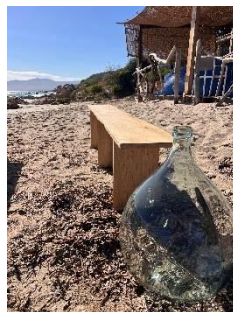
Grand Vase en verre