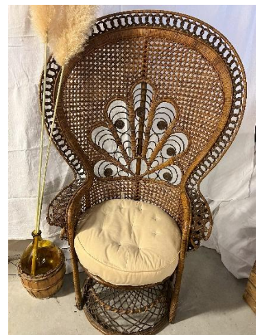
Fauteuil Emmanuelle avec coussin blanc Dimension ; L105, P74, H150 cm Poids : 8kg