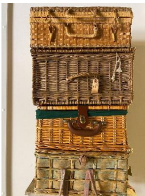
Valises panier en osier :