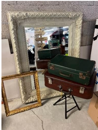
Valise différentes couleurs :