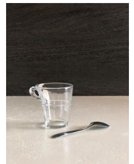
Tasse à café

Verre à vin 19cl Verre à eau 24cl Flûte à champagne 19cl