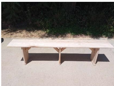
Banc en bois Dim : L 2.00 x L35 x H42cm