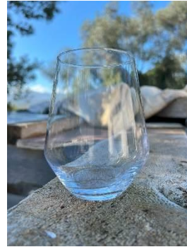
Tumbler 22cl Verre à cocktail 21cl Verre incassable 25cl Verre salsa 35cl