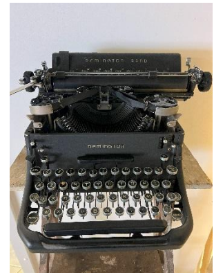
Ancienne Machine à écrire