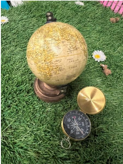
15diam Boussole 4.5cm