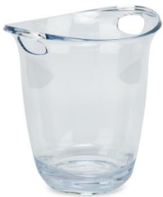
Seau à champagne