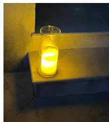
Vase tube H17cm diam11cm