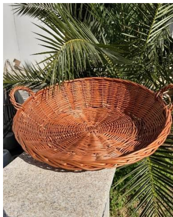
Panier Osier Dimensions : 46x36xH37