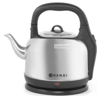
Théière 5 litres