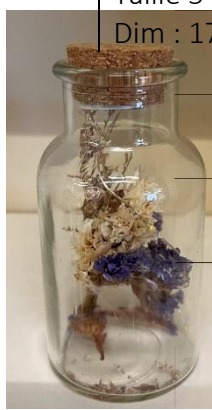
Taille 5 Dim : 17hx8diam