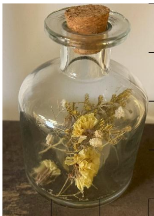
Taille 1 dim : H12cmx 8cm diam