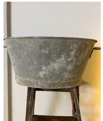
Bassine en zinc Dim : 34x47xH24cm