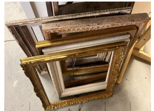
Cadres différentes tailles et couleurs :