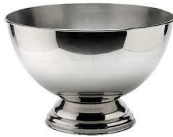
Vasque à champagne 42cm