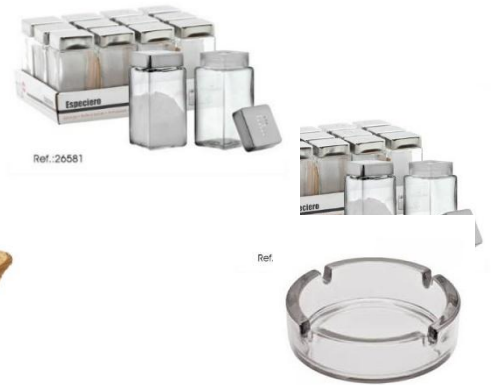
Ménagère 2 pièces set et poivre