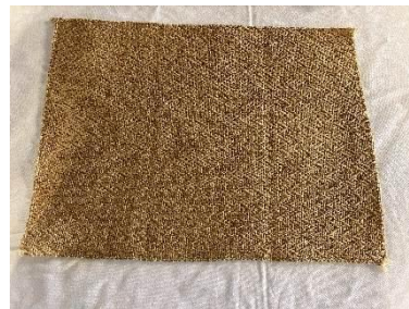
Set de table en jute Dim : 38cm diamètre