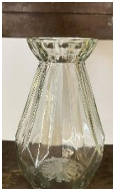
Les Vases Lalis Dim : H 15x 10diam