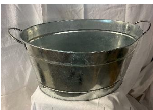
Bassine en alu Dim : 41x53H6 Dim : 27x40xH21