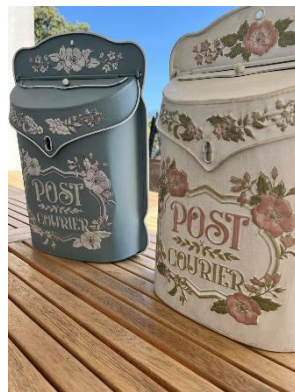
Boite aux lettres anciennes