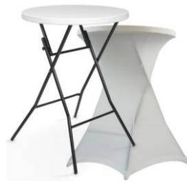
Housse mange- debout lycra Disponible en plusieurs coloris