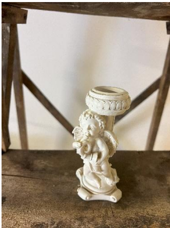
Bougeoirs thème Ange Dim: H12 cm