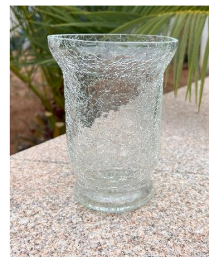
Photophore Dame Dim : 17cmHx11cm diam