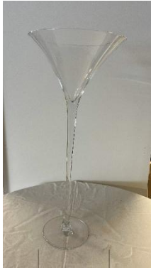
Les vases Martini