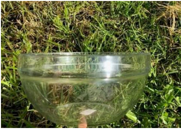
Saladier Diamètre : diam 27cm